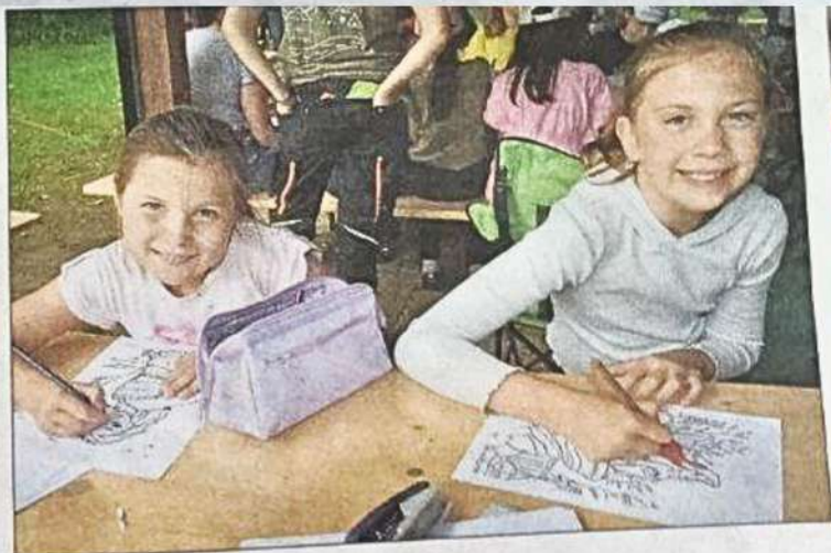
Gemalt und gebastelt wurde auch.

am Nachmittag wurden die selbst inszenierten Theaterstücke mit viel Leidenschaft und bunt kostümiert vorgeführt. Es gab noch ein besonderes Ritual für neue Teammitglieder, bei dem Schultüten auf dem Kopf getragen, eine Prüfung und Erste-Hilfe Fähigkeiten absolviert werden mussten. Eine Lagerallie und Lager Jeopardy sorgten für Furore und schließlich kam der Tag, an dem noch schnell die letzten Dinge zusammengepackt wurden, bevor man sich mit dem Lied „Nehmt Abschied, Brüder“ vom Zela verabschiedete. Den Gruppis blieb noch die Aufgabe, im Regen die letzten Zelte abzubauen, bevor auch sie in den Rheingau aufbrachen. Dort traf man sich Samstag beim gemeinsamen Gottesdienst mit den Teilnehmern der Radtour wieder und dankte für die zwei wunderbaren Ferienwochen.