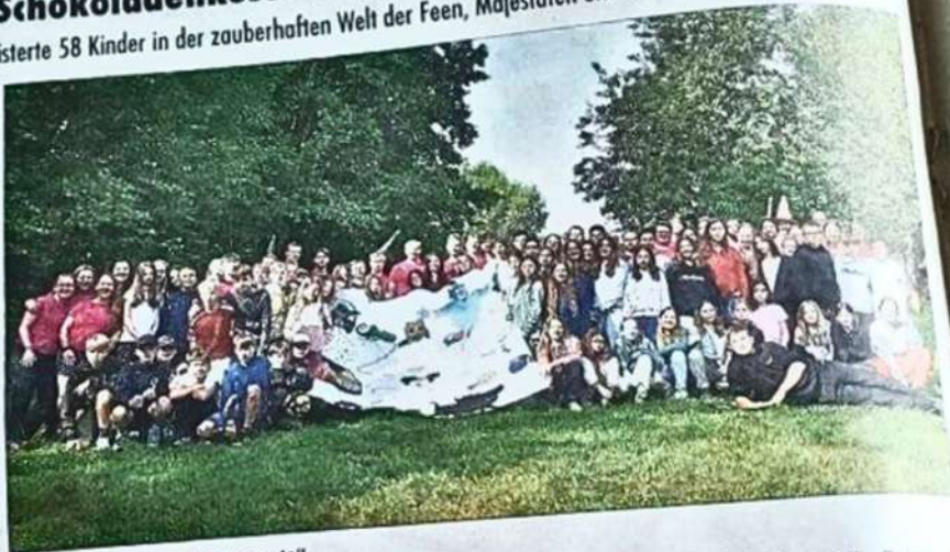
58 Kinder nahmen am Zeltlager teil.

Oestrich-Winkel. (fa) – Wenn Tinkerbell vor den Piraten gerettet werden muss und Dornröschen mit einem Schokoladenküsschen geweckt wird, dann ist Zeltlagerzeit: 58 Kinder im Alter zwischen 9 und 12 Jahren erlebten in diesem Jahr im Oestrich-Winkeler Zeltlager (Zela) der katholischen Pfarrgemeinde St. Peter und Paul in Meisenheim zwei herrlich abenteuerliche Ferienwochen in der zauberhaften Welt der Feen, Prinzen und Prinzessinnen und Helden und Heldinnen.