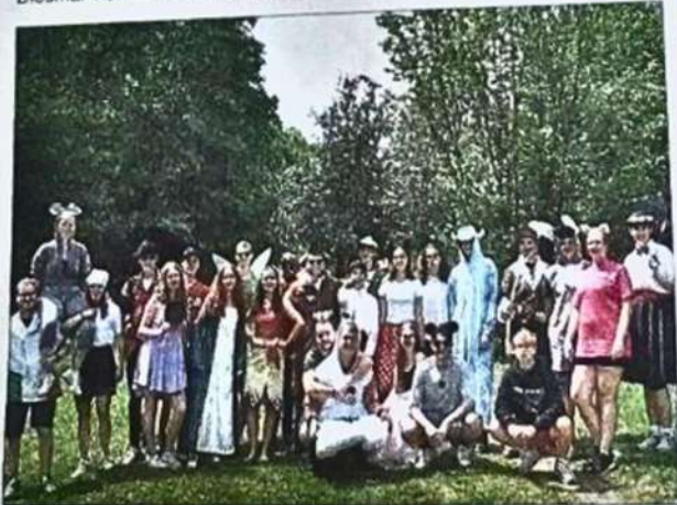
In verschiedene fantasievolle Rollen schlüpften Kinder und Lagerleitung.

bogen als Zeichen für Gottes Versprechen an Noah. Nach dem Gottesdienst wurden die von den Eltern geschnittenen, lockeren Kuchen verpackt und die heiß ersehnten Pastichen von zu Hause verteilt. So war die erste Zeltlagerwoche glücklich aus. Die zweite Halbzeit startete dann mit dem großen Zeltlager Fußballturnier bei dem mit voller Begeisterung die runde Leder gespielt und die Teams angefeuert wurden. Am Dienstag ging es beim Stadtspiel ins besinnliche Meisenheim, bei dem die Kinder auch verkleidete Küchenteam- und Waldschrat-Mitglieder finden konnten. Abends fand schließlich die heiß ersehnte Kinderparty statt. Dabei gab es nicht nur Tanz und fruchtige „Fantale“ Cocktails für die Kinder, auch Schaumkuss Wettessen und der „Limbo Wettbewerb“ wurden veranstaltet. Einen Nachschlag gab es am nächsten Tag beim Musikspiel.